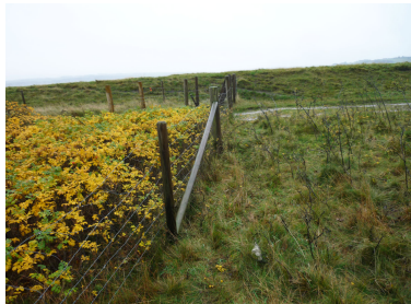
Billedet illustrerer afgræsningseffekten.

På en skala fra - 1 til + 7 ligger Rynket rose på -1. Læs mere om vurderingen af naturpleje samt plus- og minusarter her